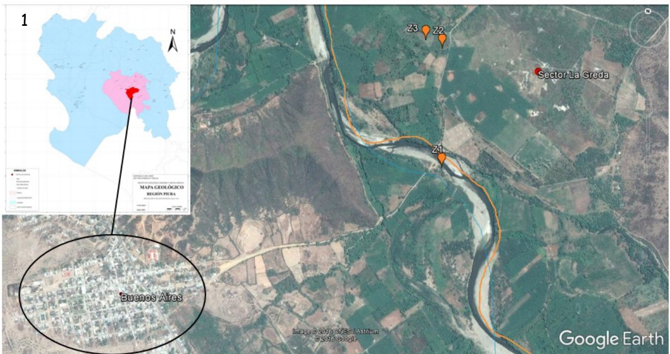
Fig. 1. - Mapa de Piura, donde puede observarse el distrito de Morropón (rosado), la provincia de Buenos Aires (rojo) y el sector "La Greda" (Delimitación con línea naranja), donde se señalan las tres zonas de estudio.

Yanes, G.; Pérez, M.; Ramírez, O.; Morón, M.; Carrillo, H. & Romero, A. 2015. Diversidad de coleópteros copro-necrófagos en el "Rancho Canaletas", Paso del Macho Veracruz, México. Acta Zoológica Mexicana , 31 (2): 283-290.